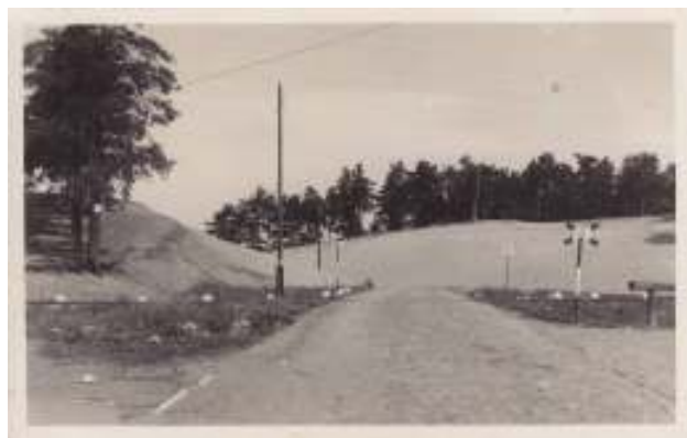
Teabetahvli paigaldas Nõmme Tee Selts kultuuripärandi aastal 2013

Nõmmelt, siitsamast, kus praegu on tihe liiklus ja ülekoormatud Nõmme liiklussõlm, läks omal ajal mäest alla munakivi tee Kadaka külla. Hobuse ja rongi kokkupõrkeid hoidis ära tõkkepuu – Schlagbaum . Rongil oli siin Nõmme turu peatus.